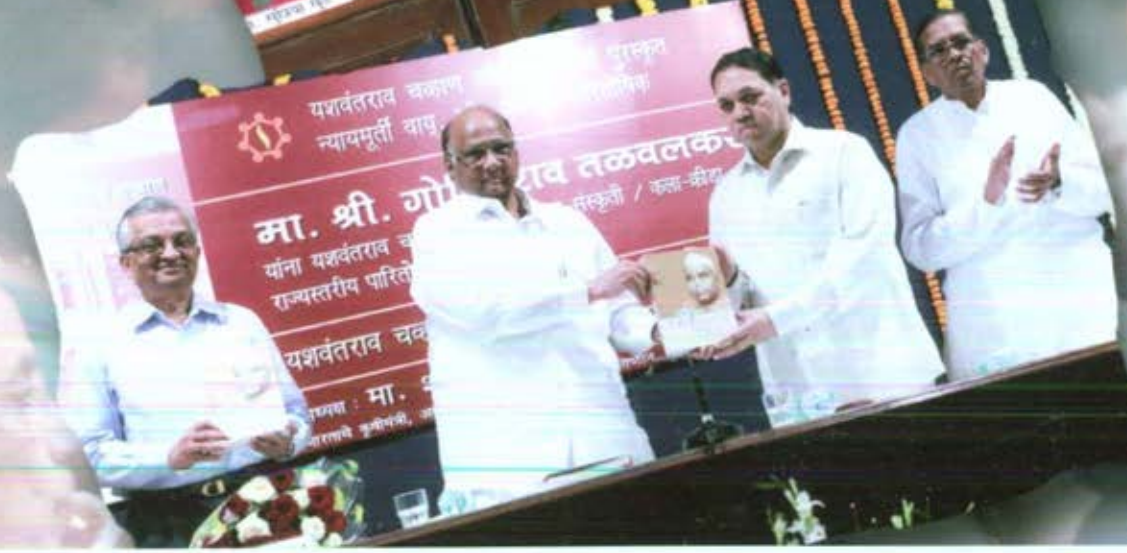
यशवंतराव चव्हाण प्रतिष्ठान, मुंबई पुरस्कृत न्यायमूर्ती वायू. व्ही. चंद्रचूड पारितोषिक मा. श्री. गोविंदराव तळवलकर यांना यशवंतराव चव्हाण मराठी साहित्य-संस्कृती / कला-क्रीडा राज्यस्तरीय पारितोषिक २०१३

श्री. मा. शरद पवार अध्यक्ष, आणि अध्यक्ष यशवंतराव चव्हाण प्रतिष्ठान, मुंबई