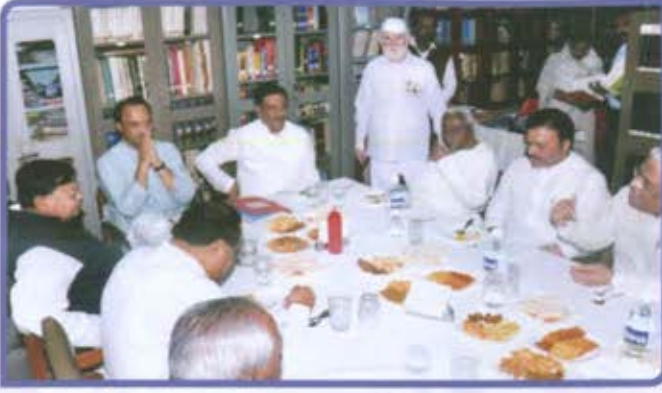
विभागीय केंद्र, कन्हाड