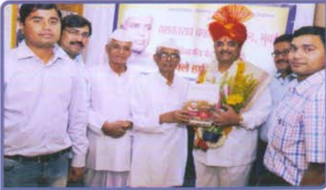
विभागीय केंद्र, लातूर