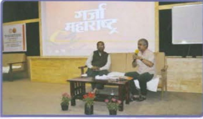
विभागीय केंद्र, औरंगाबाद 'लोकसंवाद' ग्रंथचर्चा गर्जा महाराष्ट्र