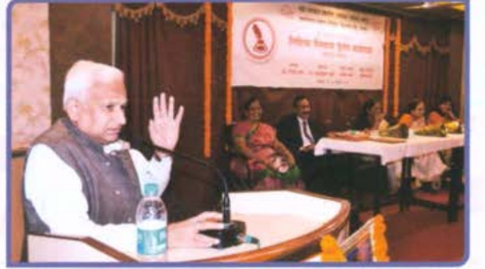
विभागीय केंद्र, नागपूर लिहित्या स्त्रियांची कार्यशाळा