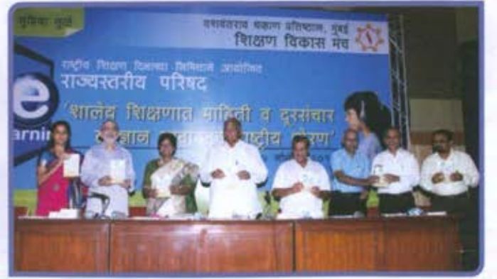
शिक्षण विकास मंच आयोजित राष्ट्रीय शिक्षण दिन परिषद