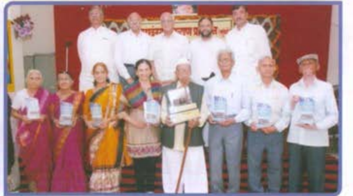
विभागीय केंद्र, पुणे 'पर्वती चढणे - उतरणे' स्पर्धा