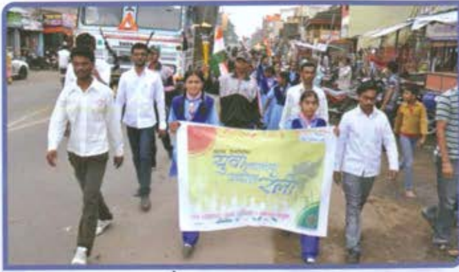
नवमहाराष्ट्र युवा अभियान आयोजित 'युवा स्वातंत्र्यज्योत रॅली', बुलढाणा