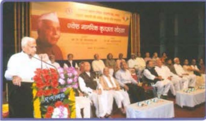
विभागीय केंद्र, नागपूर ज्येष्ठ नागरिक कृतज्ञता मेळावा