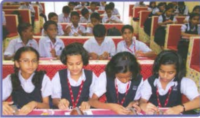
पर्यावरण संवर्धन अभियान घनकचरा व्यवस्थापन कार्यशाळा