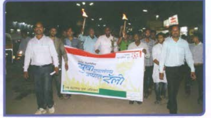
नवमहाराष्ट्र युवा अभियान आयोजित 'युवा स्वातंत्र्यज्योत रॅली', औरंगाबाद