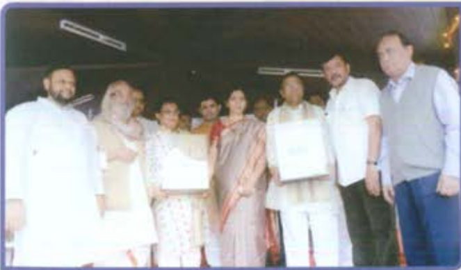
विभागीय केंद्र पुणे 'दिवाली पहाट' कार्यक्रम