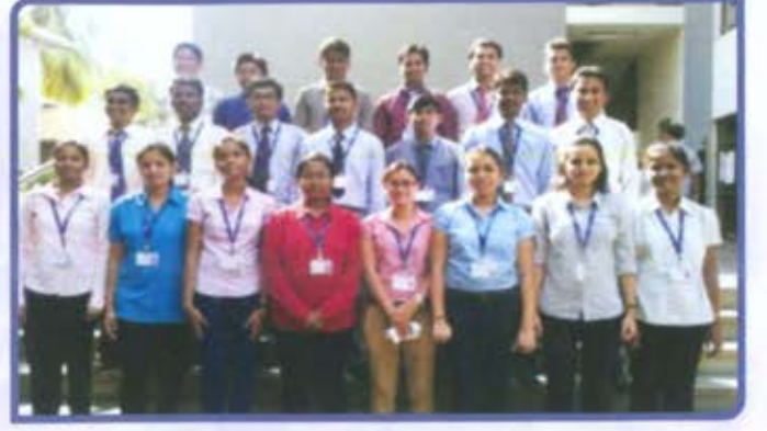
माहिती व तंत्रज्ञान प्रबोधनी