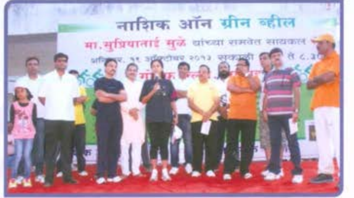
विभागीय केंद्र, नाशिक नाशिक ऑन ग्रीन व्हील