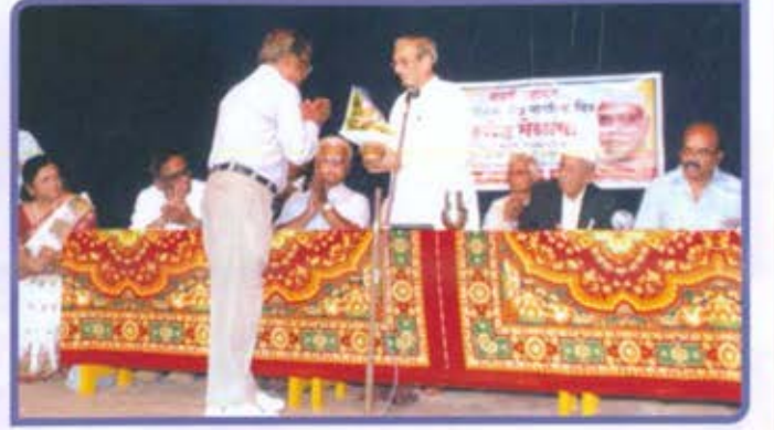
विभागीय केंद्र, कोकण ज्येष्ठ नागरिक दिन आनंद मेळावा