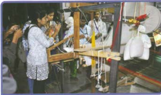
नवमहाराष्ट्र युवा अभियान - अभिसरण, पश्चिम महाराष्ट्र ते मराठवाडा