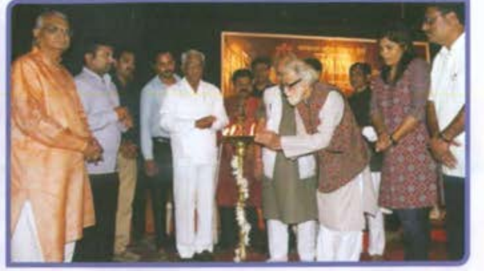
विभागीय केंद्र, औरंगाबाद विस्मिल्लाह खान शहनाई महोत्सव