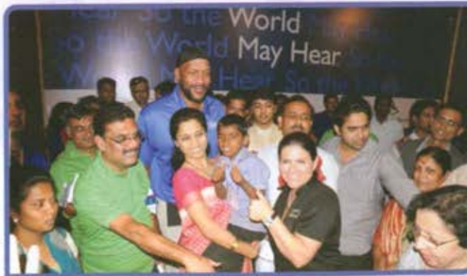
अपंग हक्क विकास मंच