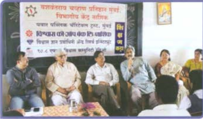
विभागीय केंद्र, नाशिक 'शिक्षण कट्टा'