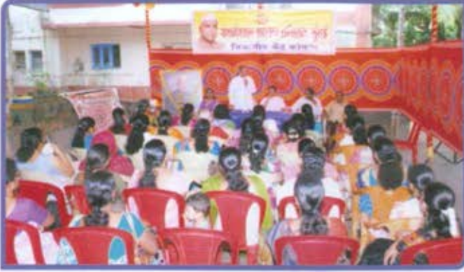
विभागीय केंद्र, कोकण मा. यशवंतराव पुण्यतिथी कार्यक्रम