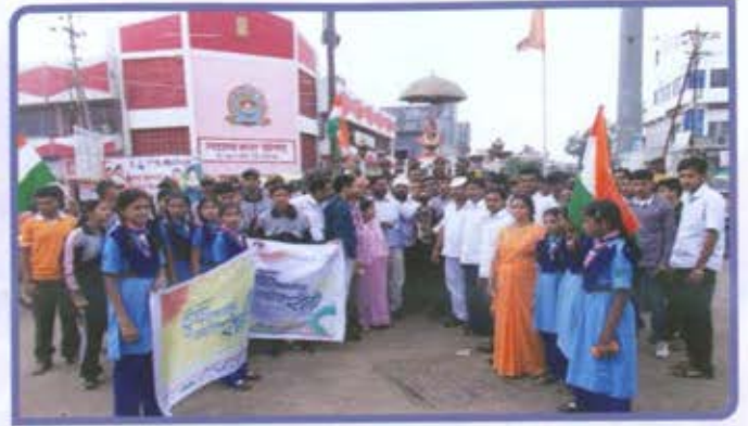
नवमहाराष्ट्र युवा अभियान आयोजित 'युवा स्वातंत्र्यज्योत रॅली', सटाणा (नाशिक)